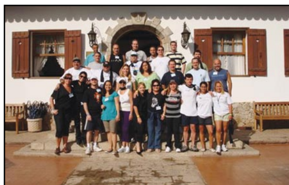
Grupo SEAC-RJ e BRALIMPIA

Questões como mercado, leis do setor e responsabilidade sócio-ambiental também foram temas de palestras e das atividades em grupo. Além da superação de limites, o evento proporcionou troca de experiências e gestão empresarial entre os participantes.