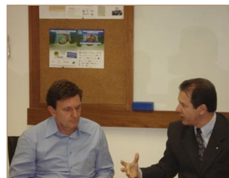
A palestra do senador Marcelo Crivella do PRB foi bastante concorrida

O candidato Marcelo Crivella (PRB) afirmou compreender as propostas apresentadas e se comprometeu em avaliar todas as questões. Mas, se antecipou anunciando que abrirá as escolas municipais, no período noturno, caso eleito, para servir de local para formação profissional voltada ao setor. Crivella demonstrou sua intenção de reduzir impostos de empresas que queiram se instalar em comunidades carentes e de fazer parcerias com os outros níveis de governo para a criação do Bilhete Único sobre os transportes. O candidato ainda declarou: “Vocês (empresários do setor) são grandes colaboradores para que o carioca viva melhor”.