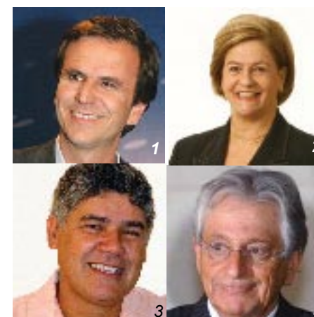
1. Eduardo Paes (PMDB); 2. Solange Amaral (DEM); 3. Chico Alencar (PSOL); 4. Fernando Gabeira (PV).

No mês de setembro, o SEAC-RJ, de forma democrática, receberá, em sua sede, os demais candidatos à prefeitura da cidade do Rio de Janeiro.